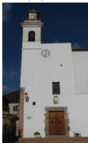
* Texto original, José Martí Coronado, Cronista Oficial de Chóvar y de la Villa de Azuébar.

En general responde a los cánones neoclásicos, pero todavía con abundante decoración de rocallas sobre talla de yeso. Fachada estrecha con torre en el lado izquierdo con puerta dintelada y sobre esta una hornacina con un panel de azulejos dedicado a Santa Ana y la Virgen. Posee piedra de sillería en el lado izquierdode la fachada.